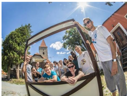
Wegweiser-Camp Arnsdorf 2018

Im Call 03/2018 bewarb sich die Evangelische Kirchengemeinde Arnsdorf um Fördermittel für ihr Wegweiser-Camp 2019. Im Rahmen eines Jugendcamps sollen modernisierte Schilder an den Orientierungspunkten des ökumenischen Jakobspilgerweges angebracht werden. Die Jugendlichen aus aller Welt werden sich neben der Wegeerneuerung des Pilgerweges mit Themen der Landschaft, mit den Menschen und der Geschichte der Region vertraut machen. Im Umkehrschluss ergeben sich für die „Einheimischen“ die Möglichkeiten zur Präsentation der Heimat vor internationalem Publikum. Die in- und ausländischen Jugendlichen werden zu Wegweisern in Sachen Offenheit und die Einheimischen werden zu Wegweisern in puncto Orts- und Geschichtskennntnis.