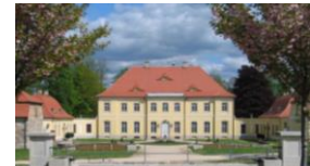
Kräutertag im Schlossgarten

Im Schlossgarten des Königshainer Schlosses finden Sie Raritäten und Köstlichkeiten aus unserer Region sowie Kreatives zur Sommerzeit am 24. Juli